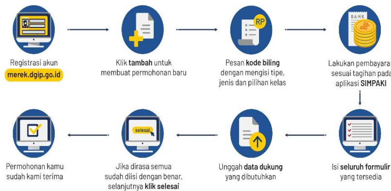
Gambar 2. 1 Proses Pendaftaran Merek Secara Online

Untuk mendaftarkan merek secara online bisa mengikuti cara seperti yang ada pada gambar diatas, sebelum mendaftarkan merek itu pemohon harus melakukan registrasi pada situs yang tertera lalu melakukan pemesanan kode billing pada situs http://simpaki.dgip.go.id/ dan membayarnya, setelah itu dilanjut untuk mengisi formulir yang tersedia dengan benar juga unggah data yang dibutuhkan seperti label merek yang apabila merek itu berbentuk 3 (tiga) dimensi maka label merek harus dilampirkan dalam bentuk karakteristik merek itu dan apabila mereknya berbentuk suara maka label merek dilampirkan dalam bentuk notasi dan rekaman suara, tanda tangan si pemohon, surat keterangan UMKM jika memang pemohon merupakan usaha kecil dan lakukan submit data pemohon, setelah itu dapat dicetak dan akan dilakukan pengecekan oleh petugas.